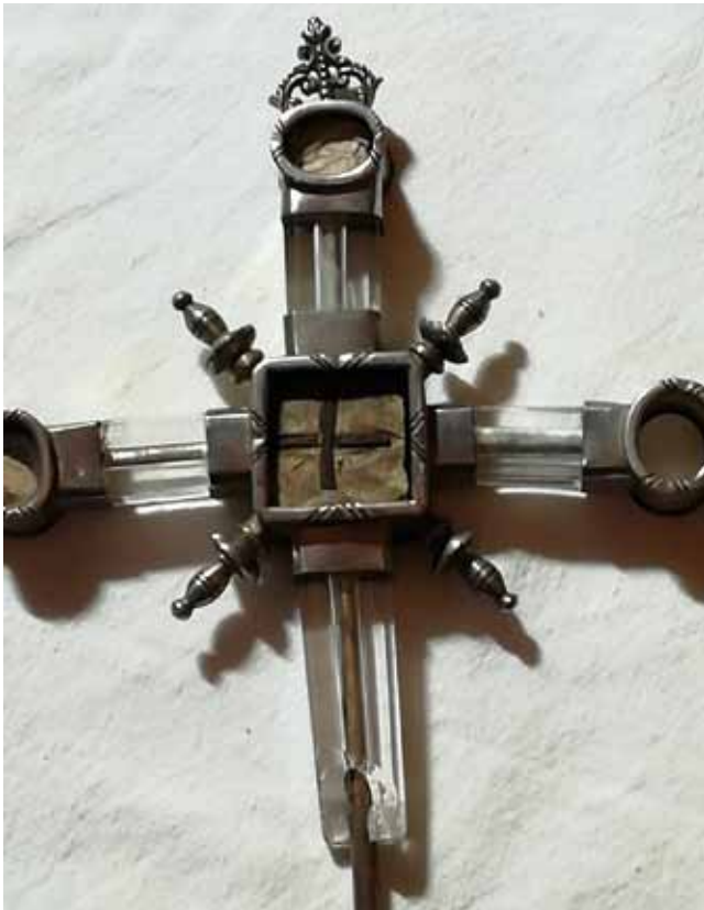
Lám. 7 Lignum Crucis do Mosteiro de Penamaior (Becerreá)

francés mantense na memoria dos veciños e aínda o usaban como deslinde de propiedades. Nos libros de Penamaior encontrámolo con frecuencia deste mesmo xeito.