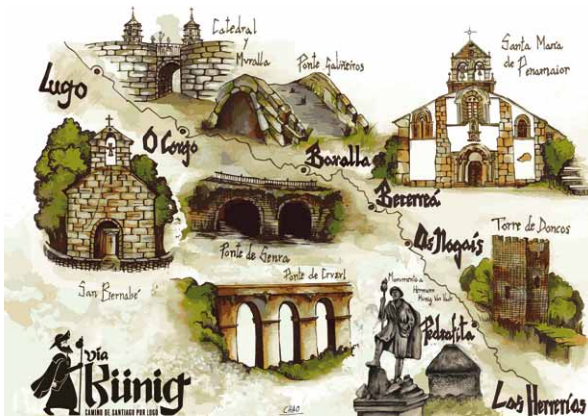
Lám. 2 Mapa gráfico do itinerario seguido por Künig entre Herrerías de Valcarce e Lugo.

esta tarefa debeuse á súa fama como predicador. O gran éxito deste segundo intento de establecer conventos Servitas na Península tivo a súa recompensa, xa que o mosteiro feminino de Santa Ana de Morvedre (Sagunto) adheriuse á Orde en 1489.