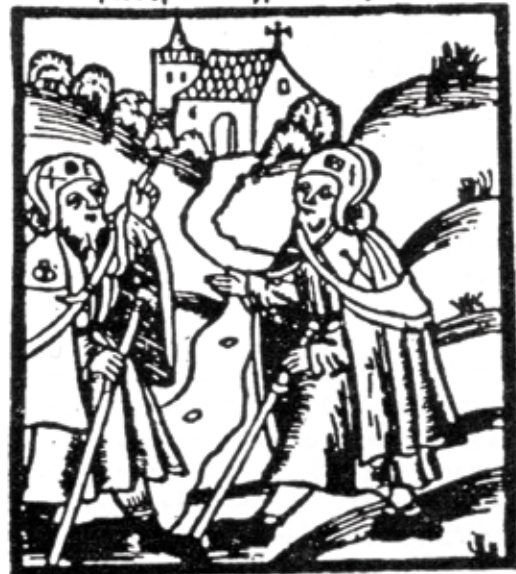
Lám. 4 Xilografías das distintas edicións da guía de peregrinos de Künig. Ezq. superior primeira edición de 1495. Drcha superior edición sen data de Estrasburgo. Ezq. inferior edición de Núremberg sobre 1520. Drcha inferior edición de Leipzig de 1521.

Die strasz vnd weylen zu sant Jacob auß vnd ein in warheyt ganz erfarn findstu in dysem buchlein