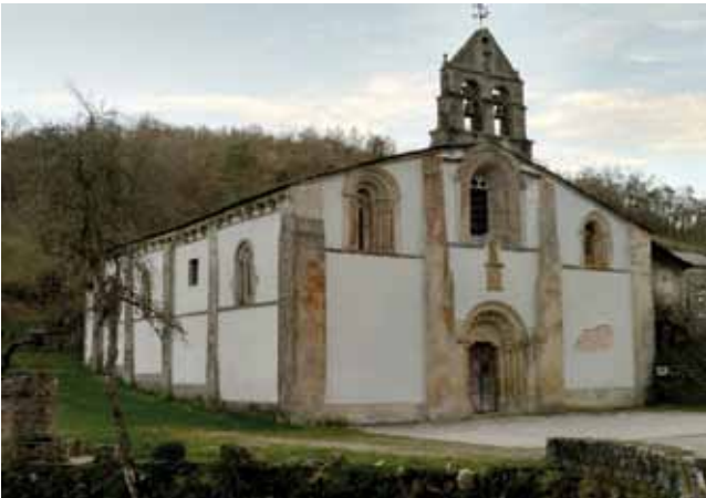
Lám. 6 Igrexa do Mosteiro de Penamaior (Becerreá)

Un dos grandes atractivos dos camiños de peregrinación eran as reliquias e os obxectos sagrados. Penamaior dispoñía deles, e este feito fixo que o número de peregrinos que chegaban alí para venerar ditos obxectos fora en aumento. O tempo que aumenta o número de peregrinos, aumenta tamén o número de donacións particulares, pecuniarias ou en propiedades, a prol do convento. Ademais destes donativos, Penamaior recibía tamén agasallos por parte dos reis, en forma de privilexios. O convento vive a súa época dourada e o seu máximo esplendor económico durante a Idade Media.