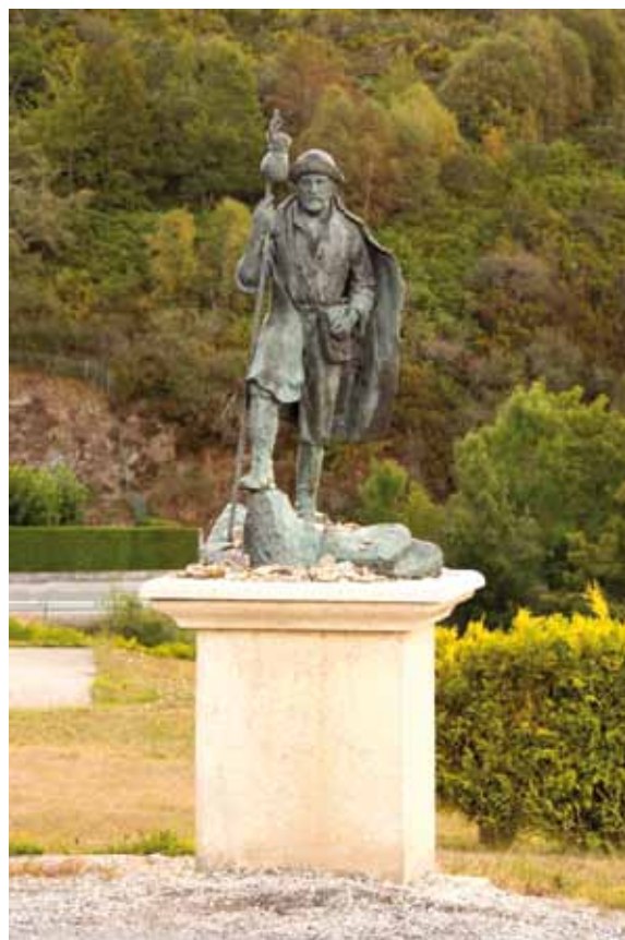
Lám. 1. Estatua de Hermann Künig na rotonda de acceso a Pedrafita do Cebreiro.

Durante toda esta etapa no convento prepararía a conciencia a peregrinación a Santiago. Unha tarefa realmente complexa pola propia dificultade